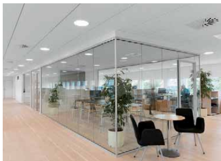
Nella sede danese della società LE34, il controsoffitto Rockfon Blanka è stato scelto per le prestazioni acustiche e l'alto indice di riflessione che ha contribuito ad aumentare la diffusione della luce perimetrale, rendendo più luminosi anche gli ambienti riunione posti al centro dell'open space