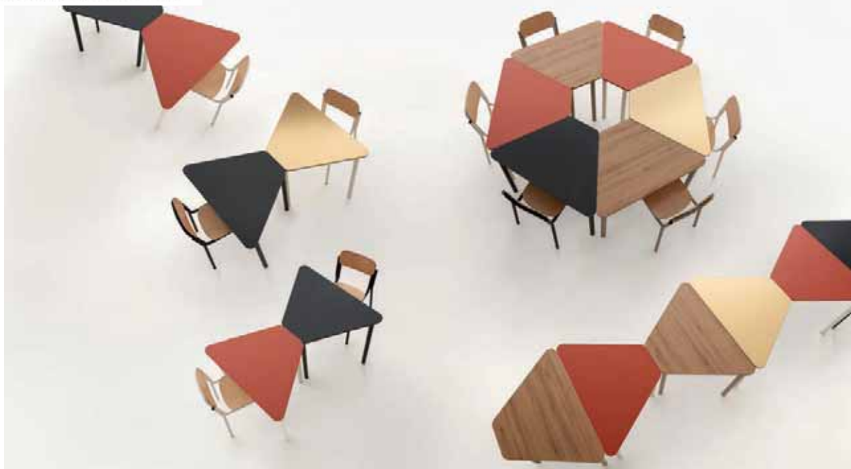
Easy di Manerba è la collezione di tavoli spostabili, modulari aggregabili in diverse forme geometriche per aree meeting che richiedono vari tipi di configurazioni

possibilità di realizzare fuori misura, nonché la predisposizione e l'integrazione di tecnologie informatiche indispensabili nei tavoli di ultima generazione.