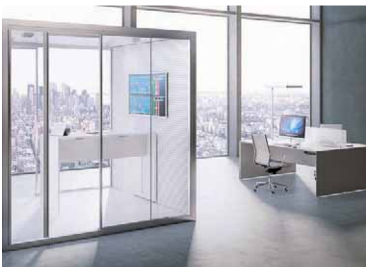
Acoustic Room di Fantoni è un box in box composto da due moduli di diverse dimensioni (b254xl254xh254cm - b254 xl134xh254cm) che definiscono isole all'interno di spazi ad alta frequentazione. Il modulo è costituito da pannelli fonoassorbenti 4akustik, prodotto della divisione Acoustic Panelling

A completamento della sala, vengono previsti mobili contenitori, boiserie, librerie, madie, porta tv, supporti e contenitori multimediali, etc, tutti elementi caratterizzati da un evidente aspetto estetico, da una buona funzionalità, e da un'efficace tecnicità. Parola d'ordine leggerezza ed eleganza, senza perdere di vista anche in questo caso le utilissime soluzioni destinate a contenere tecnologie indispensabili per il lavoro di gruppo, anche a distanza".